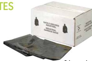
Prix par caisse