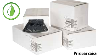
Prix par caisse