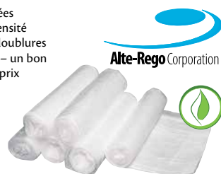
JD055 Prix par caisse